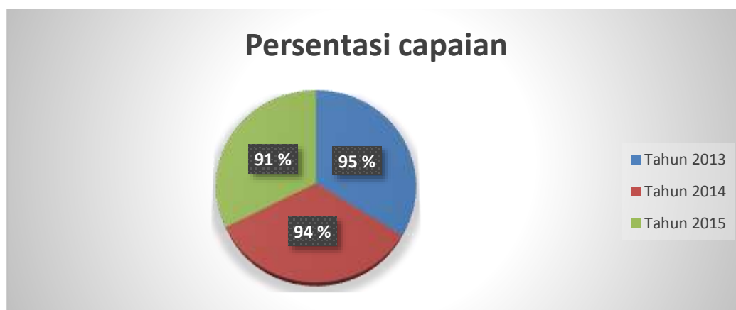
Gambar 3. Persentasi Capaian Realisasi Anggaran Tahun 2013-2015